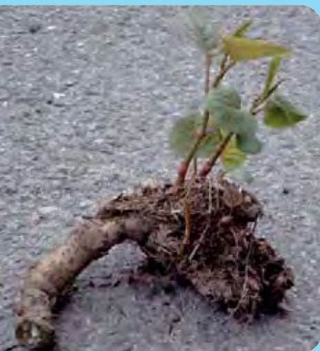
Abb. 8: Aus Knospen am Rhizomfragment können neue Sprosse austreiben