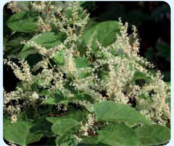
Abb. 6: Weiblicher Blütenstand von Japanischem Knöterich