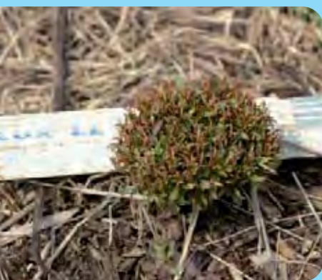
Abb. 25: Verkrüppelter Wuchs im Folgejahr nach Behandlung mit Glyphosat

Diese Genehmigungen erteilt in Sachsen die Sächsische Landesanstalt für Landwirtschaft, Fachbereich Pflanzliche Erzeugung, Referat Pflanzenschutz.