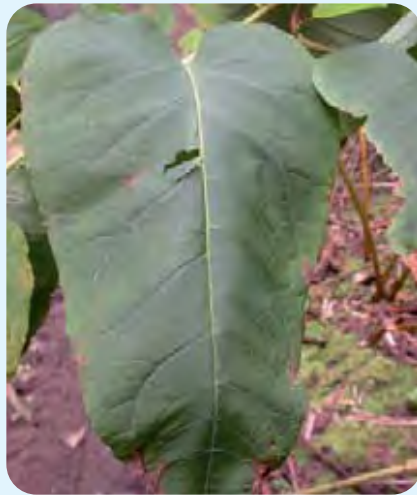
Abb. 5: Ausgewachsenes Blatt von Sachalin-Knöterich hat einen herzförmigen Blattgrund