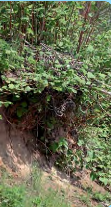
Abb. 17: Ufererosion auf einem Knöterichstandort an der Neiße bei Ostritz

Die Staudenknöteriche gehören zu den am häufigsten bekämpften Neophyten. Auf Grund ihrer weiten Verbreitung und der Dauerhaftigkeit ist eine völlige Ausrottung nicht realistisch und sinnvoll. Eine Bekämpfung in Naturschutzgebieten, in öffentlichen Grünanlagen, im Grünland und insbesondere an Gewässern sollte vorgenommen werden, wenn die Pflanzen dort Probleme verursachen. Entscheidet man sich für eine Zurückdrängung der Bestände, sollte möglichst frühzeitig mit Maßnahmen begonnen werden, bevor sich neue Bestände etabliert haben und ihre Entfernung aufwändig ist. Bei allen Methoden ist zu beachten, dass die Vermehrung und Ausbreitung über die Rhizome und/oder Spross- und Rhizomstücke erfolgen. Die bloße Vernichtung der