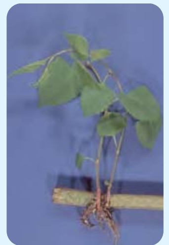
Abb. 9: Regeneration aus den Knoten aus den Stängelfragmentes

Beide Arten sowie deren Hybride haben ein sehr großes Regenerationspotential . Ein sehr kleines Rhizomfragment mit Knospen kann zu einer neuen Pflanze austreiben. Durch das schnelle Wachstum im Frühjahr, den großen Wuchs und die Ausbildung dichter Bestände sind die Staudenknöteriche sehr konkurrenzkräftig . In der Hauptwachstumsphase (Mai) kann der tägliche Zuwachs 10 - 30 cm betragen.