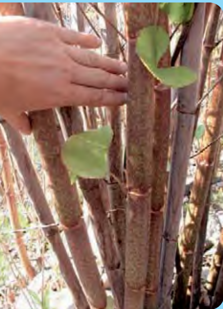
Abb. 2: Stängel der Staudenknöteriche sind oft rot überlaufen