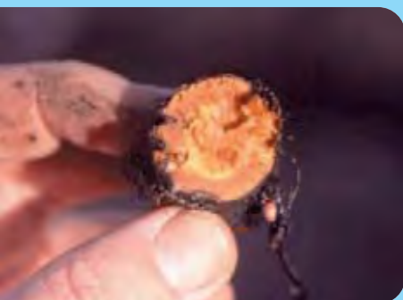
Abb. 20: Das Innere des Rhizoms ist gelblich-orange, das Äußere dunkelbraun