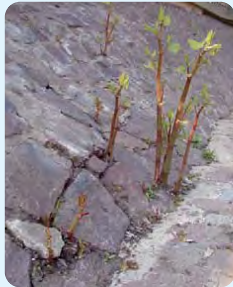
Abb. 16: Nach Hochwasser 2002 errichtete neue Ufermauer an der Weißeritz, Aufnahme Mai 2006

haben. Die dicken, feinwurzelnarmen Rhizome stabilisieren den Boden nicht genug. Zusätzlich findet man unter den dichten Knöterichbeständen kaum andere Pflanzen mit bodenfestigender Wirkung. Durch das Absterben der oberirdischen Sprosse nach dem ersten Frost ist der Boden fast kahl und kann leichter abgetragen werden als beim Vorhandensein eines naturnahen Uferbewuchses. Die dichten und harten Stängel der Knöterichpflanzen sind in der Lage, den Wasserabfluss zu hemmen und Treibgut zu fangen.