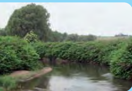
Abb. 11: Die Staudenknöteriche haben ihren Verbreitungsschwerpunkt an Fließgewässern, Neißة bei Ostritz