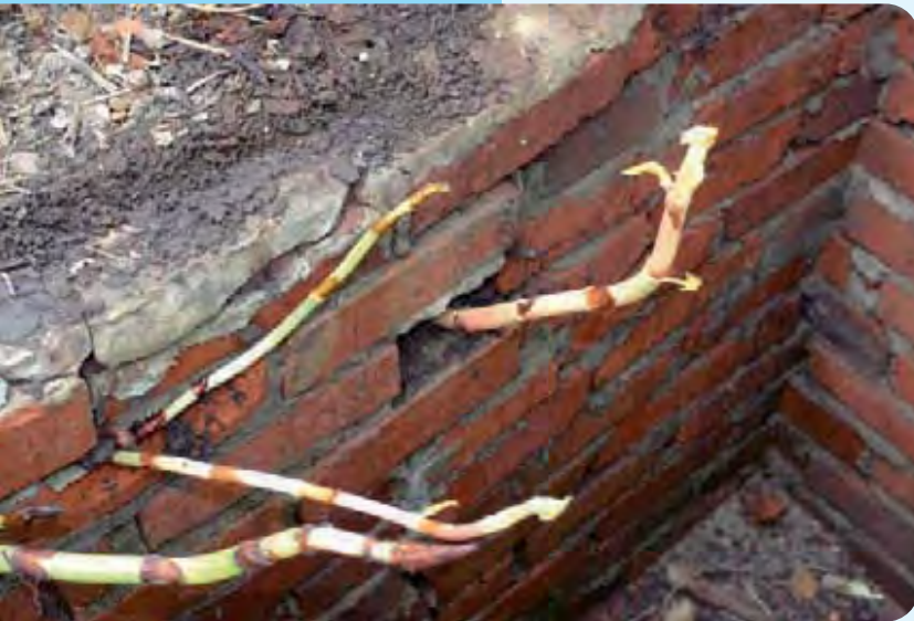
Abb. 15: Beschädigung der Mauer durch eine junge Knöterichpflanze