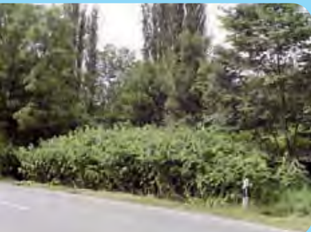
Abb. 13: Hochwüchsige Bestände der Staudenknöteriche am Straßenrand