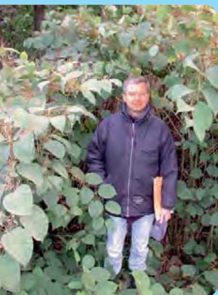
Abb. 3: Etwa 2,5 m hoher Staudenknöterichbestand