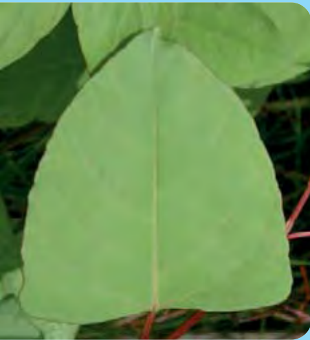
Abb. 4: Typische Blattform des Japanischen Staudenknöterichs mit gestutztem Blattgrund