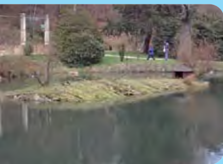
Abb. 18: Weidenspreitanlage mit austriebsfähigen Weidenruten in Jonsdorf, Landkreis Löbau-Zittau, April 2004