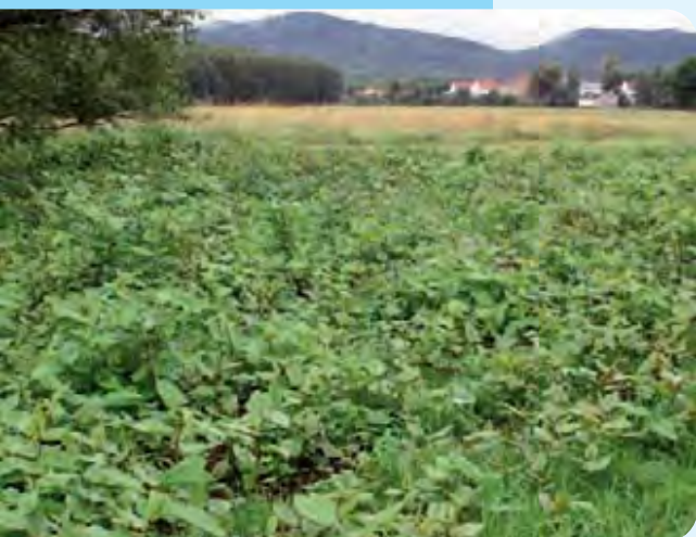
Abb. 22: Großflächiger Knöterichbestand vor der Behandlung mit Glyphosat, Landkreis Löbau-Zittau, Juli 2004