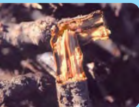
Abb. 21: Die Rhizome können leicht abbrechen

oberen Pflanzenteile führt nur bei häufiger Wiederholung dieser Maßnahme zur Zurückdrängung. Welche mechanischen und/oder chemischen Maßnahmen letztlich durchgeführt werden, ist von Fall zu Fall zu entscheiden. Hierzu gibt es folgende Methoden: