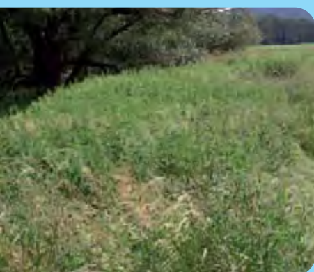
Abb. 24: Beobachtungsfläche nach der Behandlung mit Glyphosat 2004, natürlicher Gräserbestand, Landkreis Löbau-Zittau, September 2006

Bei kleineren Beständen ist das Abstreichverfahren der glyphosathaltigen Mittel (33 % Lösung) mit einem handgeführten Docht-Abstreichgerät zu empfehlen. Es sollte ein intensives Bestreichen der Pflanze erfolgen. Bei Eintragsmöglichkeiten in Oberflächengewässer auf Nichtkulturland, wie z. B. Schnittgerinne und Gully darf nur das Abstreichverfahren angewendet werden.