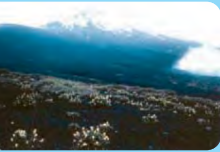
Abb. 1: Der Japanische Staudenknöterich kommt in seinem natürlichen Verbreitungsgebiet auf vulkanischen Aschefeldern vor, Mount Fuji Japan