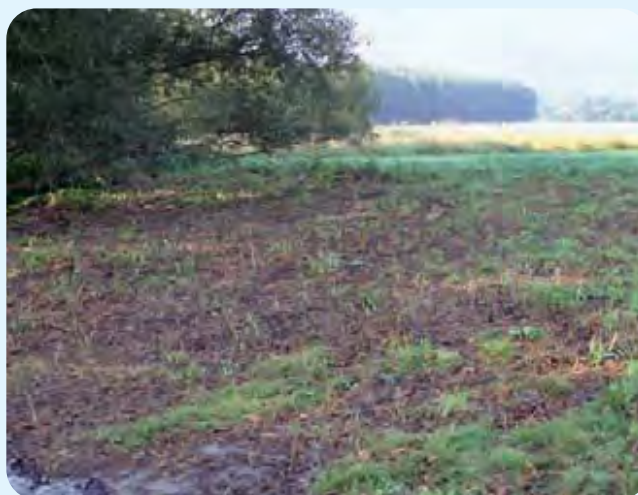
Abb. 23: Abgemähter Knöterichbestand vor der Behandlung mit Glyphosat, die Entwicklung anderer Pflanzenarten war kaum möglich, August 2004