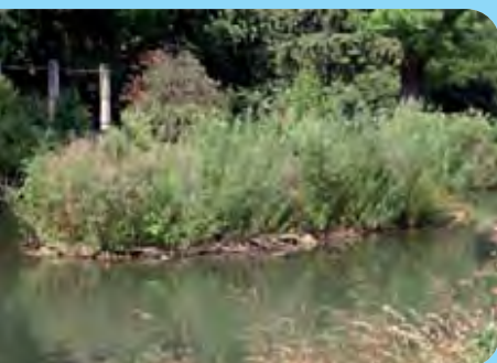
Abb. 19: Dichter Weidenaufwuchs verhindert das Nachwachsen des Knöterichs, Jonsdorf, September 2006