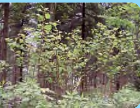
Abb. 12: Junger Knöterichbestand im Wald im Erzgebirge