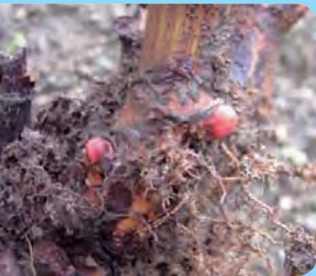
Abb. 7: Haupttrieb basis mit Bewurzelung und angelegten Erneuerungsknospen für den Sprossaustrieb im Folgejahr