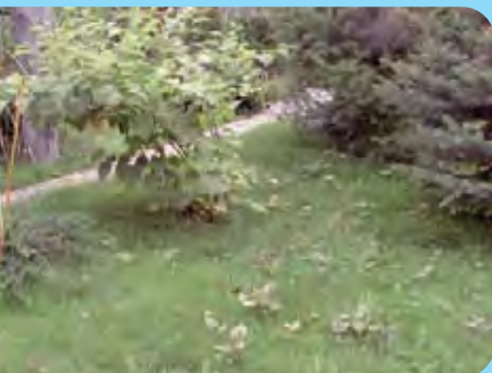
Abb. 14: Staudenknöterich im Garten, Verbreitung im Rasen