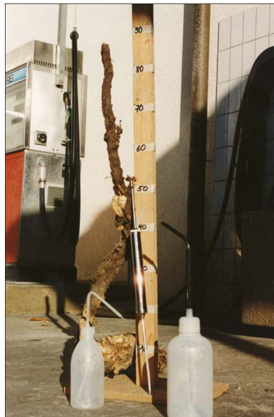
Abbildung 2: Dicke Rhizome können weit über 1 Meter tief in den Boden dringen.

Tiefe von mehr als 70 cm (Hagemann 1995). Floraweb gibt sogar eine Tiefe von 2 Metern an. Bei Pflanzen im Gleisbereich des Zürcher Hauptbahnhofs wurden dicke Rhizome bis in eine Tiefe von 1 m gefunden (Benz 1998, Abbildung 2). Die Rhizome werden mehrere Meter lang. Ein Individuum kann so einen Durchmesser von bis zu 15 Metern erreichen (Hagemann 1995). Pro Quadratmeter werden im Untersuchungsgebiet von Adler (1993) 123 m bzw. 160 m Rhizome gebildet. Die Biomasse der Rhizome erreicht bis zu 16.4 kg/m 2 Frischgewicht (5.1 kg/m 2 Trockengewicht, Adler 1993). Im Knotenbereich liegen Knospen, die austreiben können, wenn Rhizomstücke von der Mutterpflanze getrennt werden. Die jungen, dünnen Rhizome dienen als Ausläufer der Besiedlung neuer Flächen. Die Rhizome können sich an ihrem Ende aufrichten, den Erdboden durchstossen und Sprosse bilden. Dadurch werden so genannte Polykormone, d.h. durch ein unterirdisches System zusammenhängende Pflanzen, gebildet. Rhizome von mehr als 1 cm Durchmesser findet man nur dort, wo auch oberirdische Sprosse vorhanden sind (Hayen 1995). Die Wachstumsgeschwindigkeit der Ausläufer liegt in der Größenordnung von 0.5 m pro Jahr (Adler 1993, Hayen 1995), auch 1 m pro Jahr wurde beobachtet (Hagemann 1995). Die dicken, älteren Rhizome sind brüchig und können bei Erdbewegungen leicht verdriftet werden. Die Rhizome enthalten viel Stärke und dienen zusammen mit den verdickten Basalteilen der Reservestoffspeicherung.