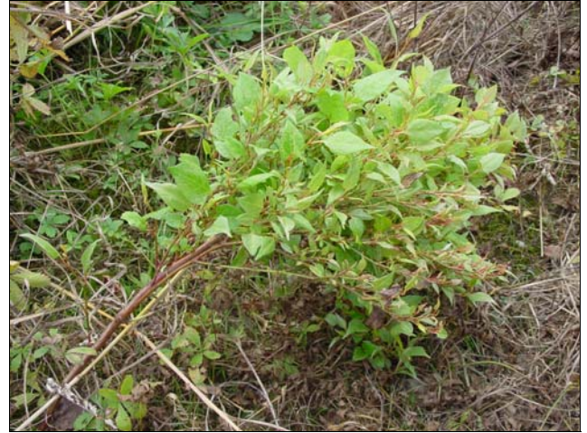
Abbildung 3: Nach Herbizidanwendung veränderte Morphologie der Sprosse: Verkürzung, kleine Blättchen, büschelartiges Austreiben.

Die Versuche der Kantonale Zentralstelle für Pflanzenschutz Aargau erreichten die besten Resultate, d.h. Wirkungsgrade bis zu 95%, wenn der Wirkstoff Glyphosat mit einer 1:1 Verdünnung einmalig mit dem Pinsel aufgetragen oder in die Stängel injiziert wurde (Huber, 2001). Somit brachte eine einmalige Behandlung mit den Varianten «Pinsel» oder «Injektion» bereits ein gleich gutes Resultat wie Spritzanwendungen über 2–3 Jahre. Mässige Wirksamkeit wurde erreicht, wenn Triclopyr oder Clopyralid 1:1 verdünnt mit dem Pinsel auf den Wurzelstock aufgetragen wurden, oder mit letzterer Substanz bei Stängelinjektion.